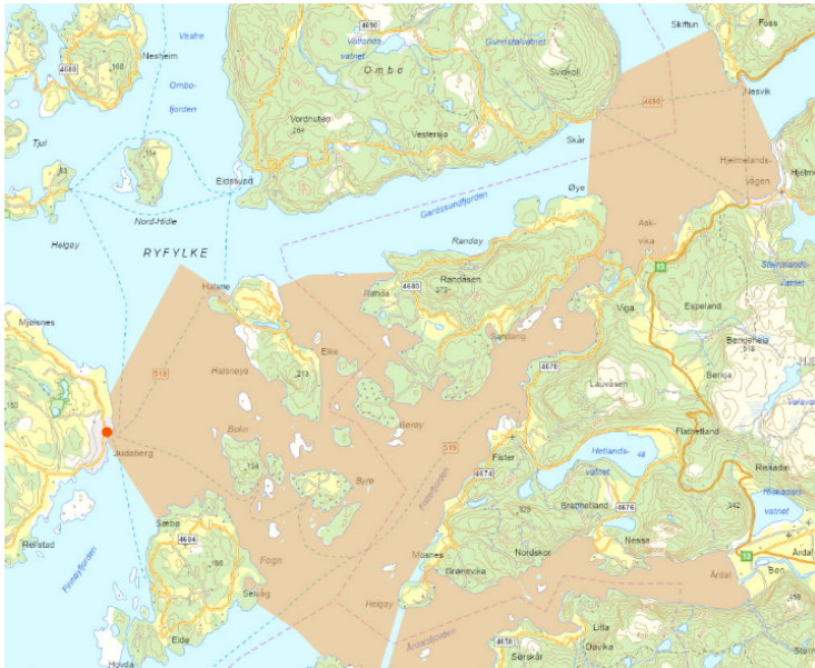
Figur 3: Oversikt over gyteområde. Det oransje området utgjør gytefelt for torsk. Rødt punkt markerer tiltaksområdet.