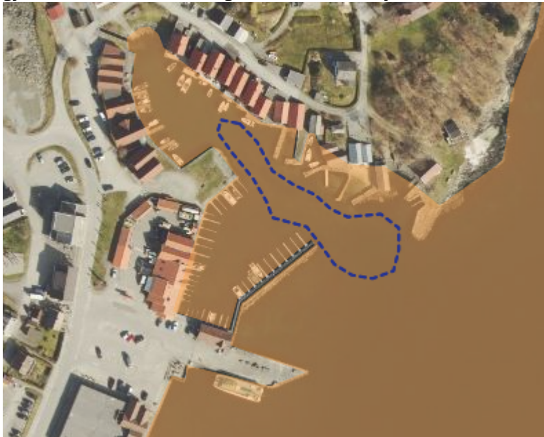
Figur 2: Oversikt over marine naturverdier i tiltaksområdet. Det blå feltet markerer en biologisk viktig ålegrasforekomst. Det oransje feltet markerer gytefelt for torsk.

Tiltaksområdet ligger i et registrert gyteområde for torsk. Dette er områder som er særlig viktige for torskebestanden i området. Gytefelt skal ikke forstyrres i gyteperioden. Tiltaksområdet ligger i gytefeltet som strekker seg østover fra Finnøy.